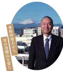
事務所屋上から 雪の浅間山を望む

〒370-0006 群馬県高崎市問屋町4-7-8 高橋税経ビル FAX:027-361-9591 URL:http://www.takahashi.co.jp/ E-mail:info@takahashi.co.jp